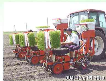
DUAL 12/6 TPI GOLD

Un solo operatore alimenta contemporaneamente 2 file di trapianto abbinate.