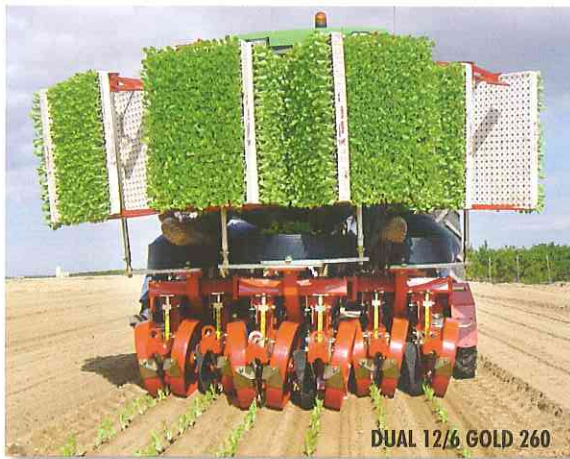
DUAL 12/6 GOLD 260

Dispositivo que permite distribuir localmente, en línea o cada planta, una pequeña dosis (regulable) de sustancia antiparasitaria microgranulada; preciso, seguro, eficaz, ecológico.